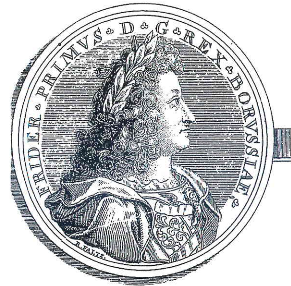
18. Januar 1701: Friedrich I. König in Preußen